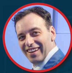
GIUSEPPE DI VITTORIO