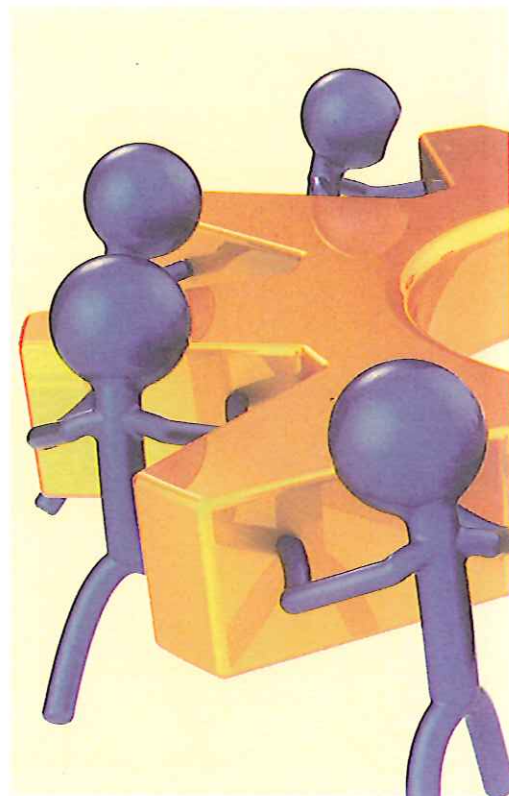
Gli studi cercano nuovi posizionamenti di merca