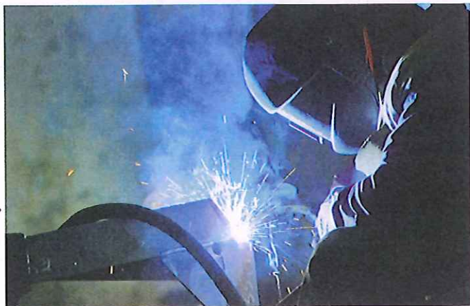
Per attirare le pmi, i legali devono offrire servizi dedicati